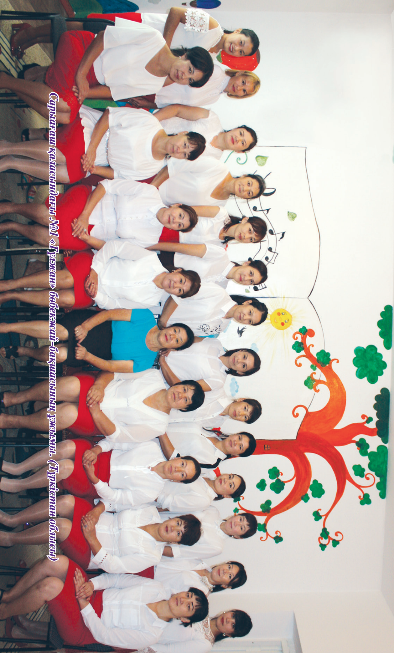
Сауықаш қаласындағы №1 «Түлекан» бөбекжай-бақшасының ұжымы. (Түркістан облысы)