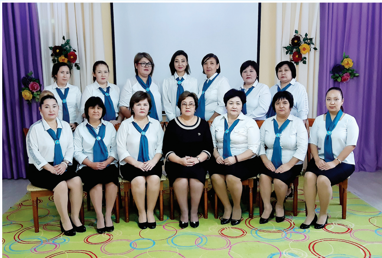
Атырау қаласындағы КМҚК №25 «Еркемай» бөбекжай-бақшасының ұжымы