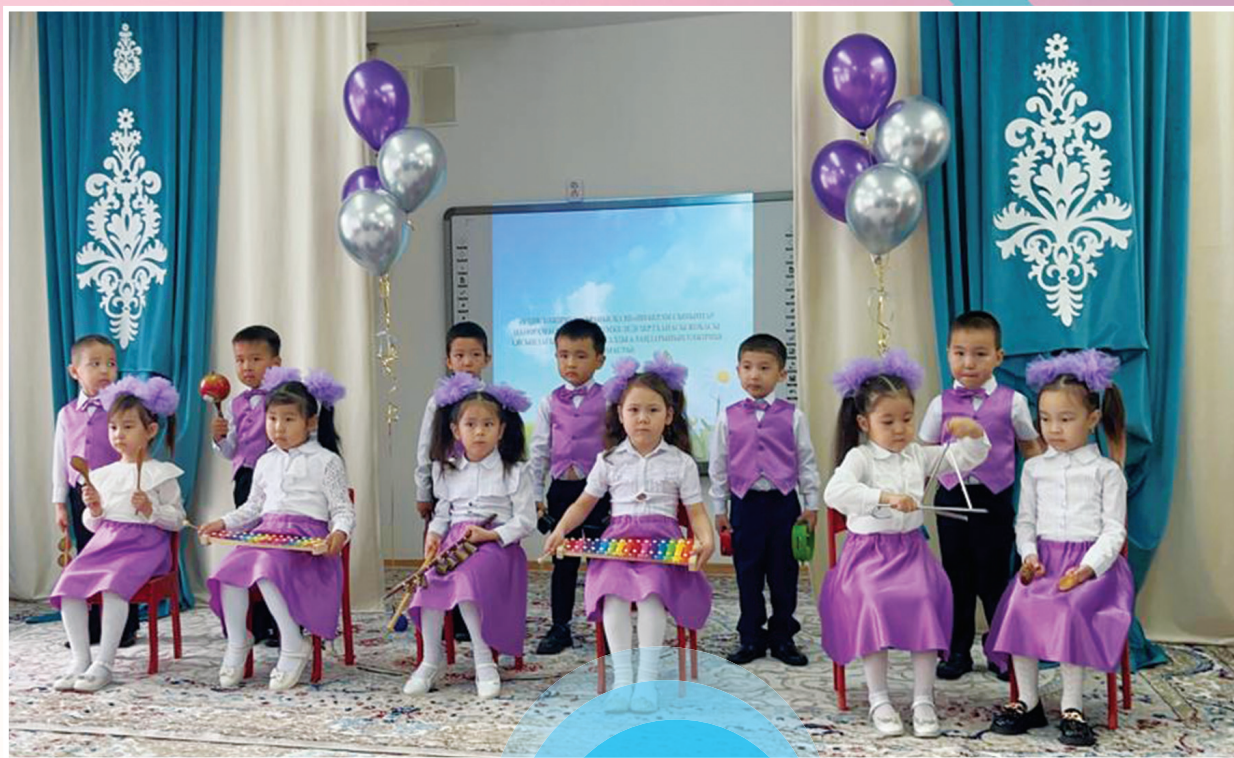
«Жаңақала балалар бөбекжайының» тыныс-тіршілігінен көріністер